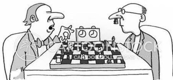
U neemt mijn paard op f5 zo te zien niet ernstig op?

Het leven is immers al serieus genoeg... Kennelijk niet voor iedereen, getuige de volgende lachprent.