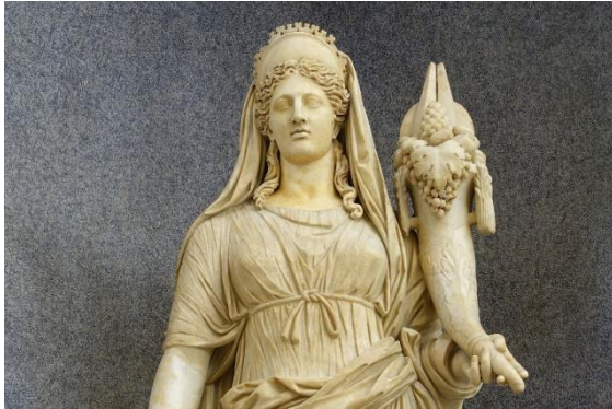
Vrouwe Fortuna met het rad van fortuin

U bent weer op de hoogte! Met dank aan mijn weldoenster.