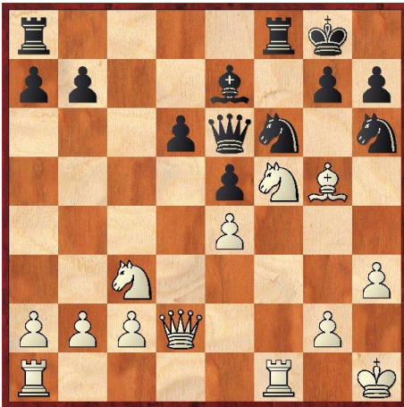
Stelling na zet 20 van zwart