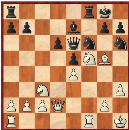
Stelling na zet 20 van zwart