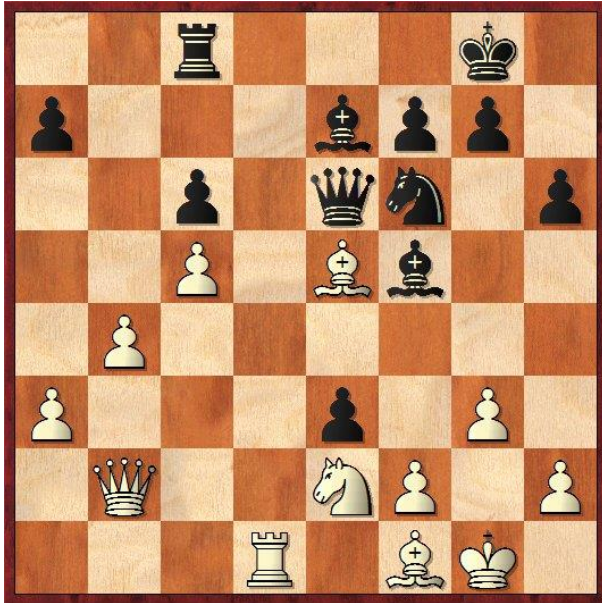
Henk van Gool – Andy Baert

26.Pf4 leek even de dame te vangen maar na het á tempo gespeelde 26...exf2+ mag de pion niet genomen worden wegens ..Pg4 met stukverlies. Er volgde 27.Kh1,Le4+ 28.Lg2,Dc4?! (...Td8!) 29.Dxf2,Lxg2+ 30.Pxg2,Pg4 31.Df5,Td8 32.Txd8+?? een echte tijdnoodblunder Nu werd de matdreiging op de onderste rij fataal. 32...Lxd8 33.Df4 (of 33.Lb2,Lf6 34.h3,Lxb2 35.hxg4,Lxa3 en van de witte damevleugel blijft op den duur niets over) 33...Pxe5 met stukwinst (34.Dxe5,Df1mat!).