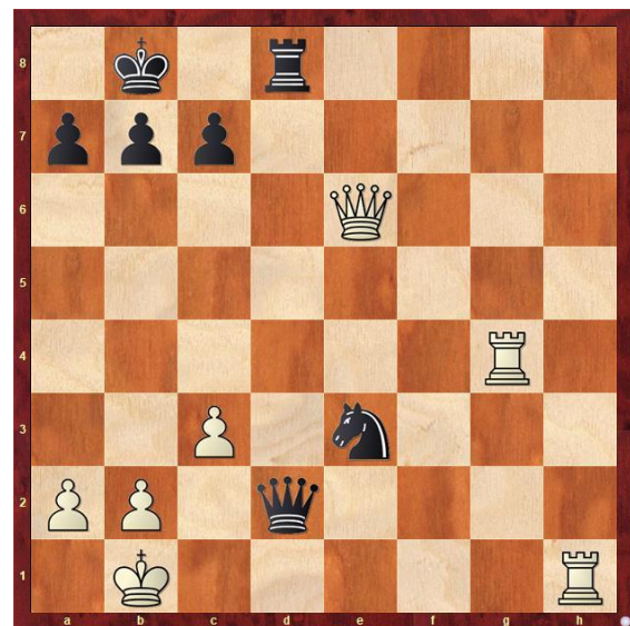
Diagram na 32...Kb8