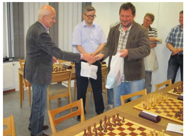
Ontmoeting in Hinsbeck

Er waren twee vriendschappelijke ontmoetingen met 'Schachgemeinschaft Nettetal', die zeer geslaagd mogen worden genoemd. De wedstrijd in Venlo werd een overwinning voor de gasten, waarna de ontmoeting in Hinsbeck met een Venlose zege werd afgesloten.