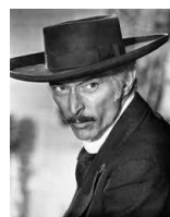
"Give up the money, or you're (a) check-mate."

Bij de laatste teksten had hij me blijkbaar in de smiezen, want plots werd de verbinding verbroken. Ook zal hebben meegewerkt, dat mijn Engels qua pronunciation steeds meer op dat van hem ging lijken. Een vrouwelijke representant van dit digitale dievengilde sprak ik in een later geval 2 minuten lang vaderlijk vermanend toe. Haar voorhoudend dat " such an intelligent nice girl like yourself is trying to embezzle money from poor sods like myself. I have to try to make both ends meet every day and I am a member of the food bank... " Enz. Tot zij dus licht snikkend ophing. 2 Nu zo'n voorbeeldboef. Opgelet!