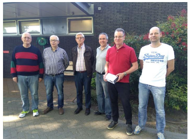
Kampioensteam Venlo 3

Ook Venlo 2 kende, ondanks versterking, in de promotieklasse van de LiSB een beroerde start. Die werd evenwel ruimschoots goed gemaakt en het team eindigde, na puntenaf trek en de zege op de slotdag tegen het zwakke GESS, op plek 6.