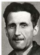
George Orwell 1903-1950

En daar zit iets in. Want van alle kanten worden we immers in de gaten gehouden, gevolgd en bespied. Grote boosdoeners zijn hier het trollende internet, bewakingscamera's, flitspalen en klikkende burens. Waardoor het inderdaad begint te lijken op de dystopische wereld zoals George Orwell die reeds voorzag in zijn boek '1984'. Big Brother die ons de ganse tijd in de gaten houdt. Dit is de visionair.