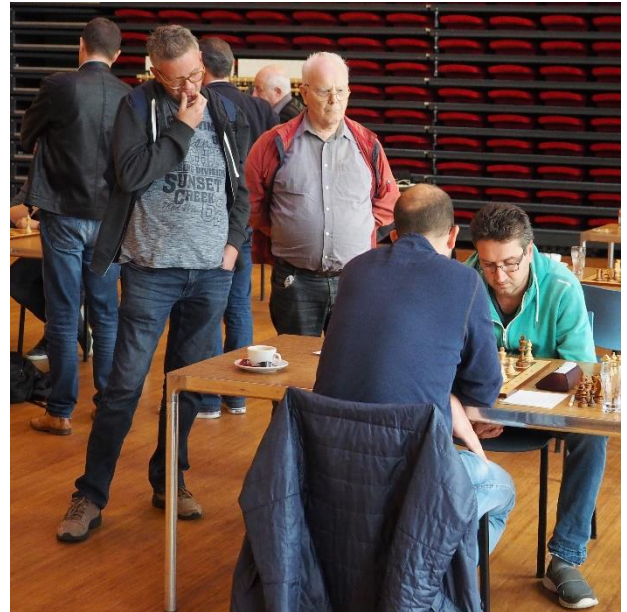
Toeschouwers bij Venlo 1

gemakkelijk seizoen tegemoet gaat. Op dit niveau kan iedereen van elkaar winnen. De gepromoveerde teams kunnen zich flink versterkt hebben om de kansen op handhaving in de eerste klasse te vergroten. Net als vorig seizoen zullen we dan ook elke wedstrijd alles moeten geven om degradatie te ontlopen. Favoriet voor de titel zal wellicht Pathena Rotterdam zijn. Dit team is afgelopen seizoen gedegradeerd uit de meesterklasse.