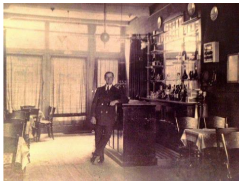
In de 'Gouden Tijger'. Ong. 1930

Later dat jaar, op 30 juni 1945 op een algemene vergadering van de LISB, stelt de VSV vast hoe men de oorlog was doorgekomen: "geen doden, alle materiaal verloren!" Vooral het verlies van de schaakklokken trekt een zware wissel op het spelen van partijen. Daarover later meer.