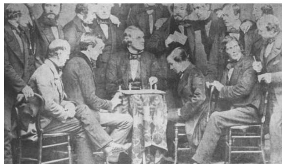
De match Morphy-Paulsen.

Want in die tijd hadden de schakers geen last van tijdnood; schaakklokken die de bedenktijd mooi in partjes sneden en bijhielden, ze waren er niet! Men mocht nadenken zo lang men wilde. En daarvan werd vaak uitbundig gebruik gemaakt. Een mooi, hoewel apocrief verhaal in dit verband, vertelt over de match in 1857 tussen Louis Paulsen en Paul Morphy. Paulsen was een zo'n beruchte langdenker. Tijdens een van hun partijen had Paulsen na zo'n twee uur nog steeds geen zet gedaan. Morphy werd het er begrijpelijkerwijs te veel aan en vroeg hem of het niet eens tijd werd om te zetten. Paulsen keek hem ontsteld aan en stamelde: "Ben ik werkelijk aan zet?" Spoedig daarna stopte het genie Morphy met schaken.