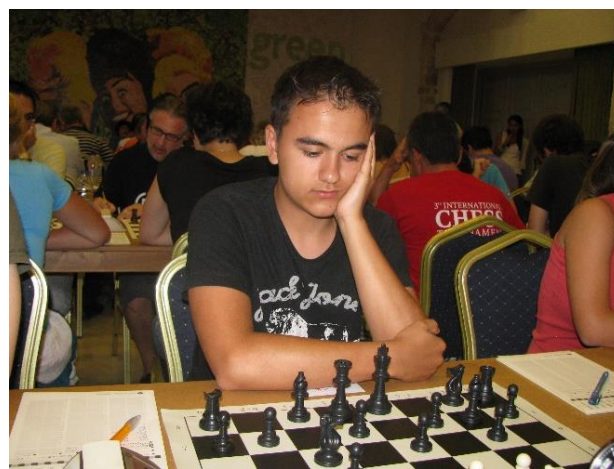
Foto uit het toernooi