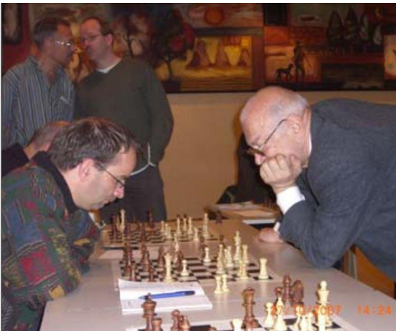
Viktor tijdens de simultaan van DJZ, december 2007