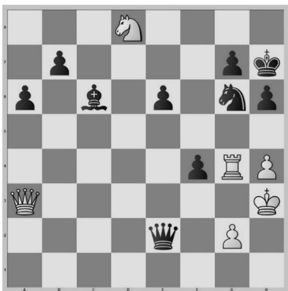
Diagram, na zet 38...Pg6

Wit heeft zijn kan gemist op remise en de koning van wit wordt een aanvaldoel voor mijn dame en paard. Daarna win ik met een mooie en lange combinatie.