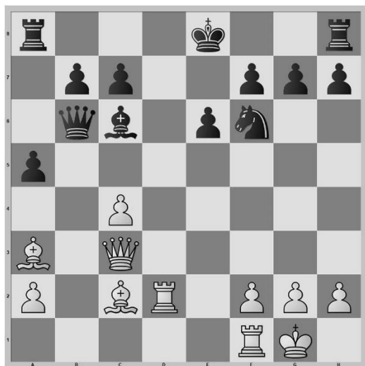
Stelling na zet 16. Lc2

1.e4 e6 2.d4 d5 3.Pc3 Pc6 4.Pf3 Pf6 5.Ld3 Lb4 6.0-0 Lxc3 7.exd5 Lxb2 8.Lxb2 Dxd5 9.c4 Dd6 10.Db3 a5 11.La3 Pxd4 12.Pxd4 Dxd4 13.Tad1 Db6 14.Dc3 Ld7 15.Td2 Lc6?! 16.Lc2